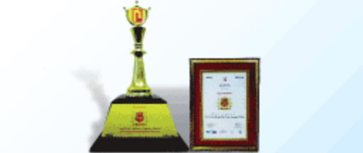
Best Managed Life Insurance Company Newbiz Business Awards 2013 & 2014